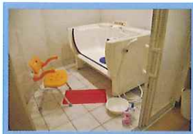
座って入れる最新浴槽