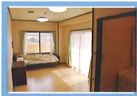
明るく展望の良い居室