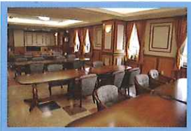
落ち着いた雰囲気の食堂

私たちは介護サービスを通じてすべての方々に心地よい豊かな生活を提供していきます。