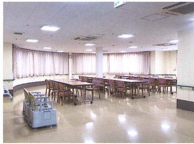
食堂・機能訓練室