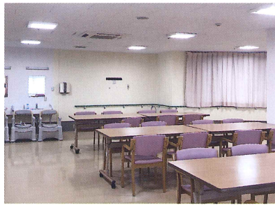
食堂・機能訓練室