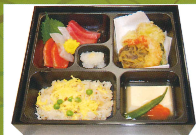
季節の献立例—松花堂弁当

季節の旬な食材を使用した行事食や日本ならではの郷土料理は、ぜひおすすめしております。専門の栄養士による栄養バランスを配慮したお食事をご用意しています。またお客様の食事形態に合わせた特別食にも対応しています。