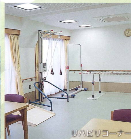
リハビリコーナー