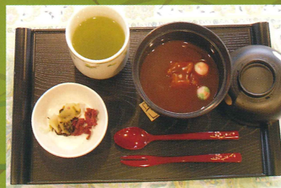
季節のおやつ例—ぜんざい