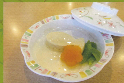
お客様の食事形態適応例—ソフト食